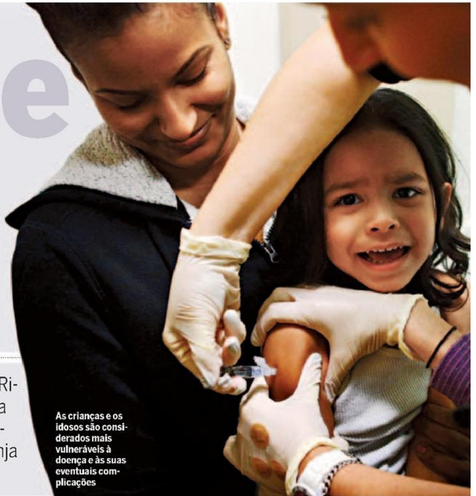
As crianças e os idosos são considerados mais vulneráveis à doença e às suas eventuais complicações

■ Dados recolhidos pelo Instituto Ricardo Jorge revelam que na última semana houve 1400 casos ■ Especialistas temem que a doença atinja em fevereiro mais de 15 mil